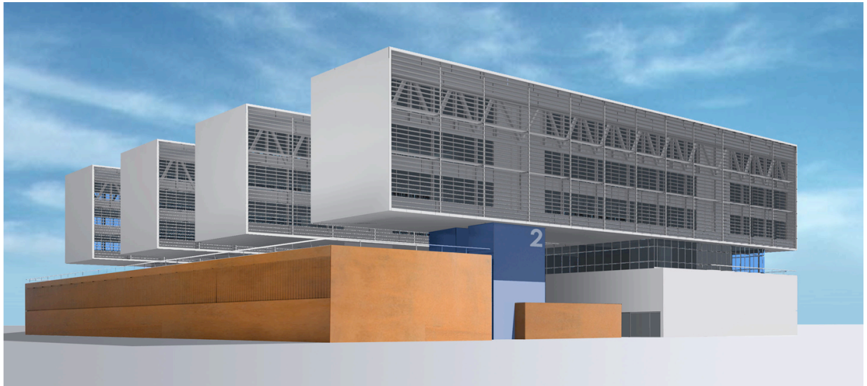
Futuro Centro de Transferencia de Resultados de Investigación

5.a.7. Nuestro objetivo es haber aumentado en un 50% el retorno por contratos 68/83 en 2015.