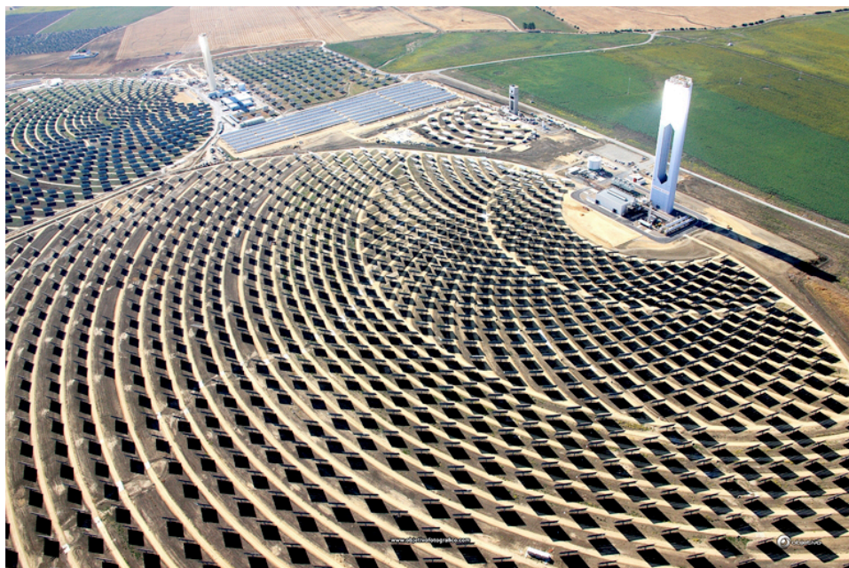
La agregación en la vanguardia tecnológica: Planta termosolar PS-20 de Abengoa.